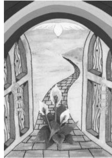
Gerechtigkeit, Gottes Friede und Vergebung.

Dienstags von 14.30 bis 16.30 Uhr im Gemeindehaus der Lutherkirche Barbarossaring 26