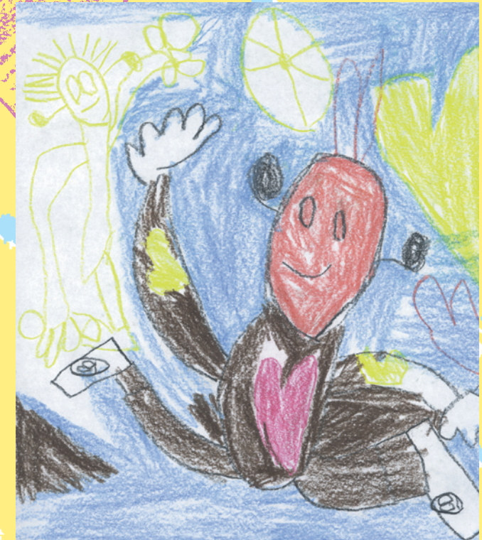
Zeichnung: Etienne, 7 Jahre

Ein Gruß von deiner Kirche zu deinem 2. Taufstag