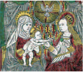
(H)anna, Maria und das Jesuskind. Um 1500

In der hebräischen Bibel lautet der Name Channa; das hängt zusammen mit einem Wort für „Gnade, Barmherzigkeit, Anmut“: Gott hat der Mutter Gnade gezeigt, indem er ihr dieses Kind schenkt (vgl. englisch grace ). – Im Alten Testament ist Hanna die Mutter des Propheten Samuel. Nach langer Unfruchtbarkeit und viel Spott ihrer Konkurrentin Prinah bekommt sie einen Sohn; ihr Lobgesang nach der Geburt ist einer der schönsten Psalmen (1. Samuel 1-2 und 9). – Dieser Geschichte offensichtlich nachgebildet ist die Erzählung von der heiligen Anna, angeblich die Mutter Marias und Großmutter Jesu. Im 2. Jahrhundert entstehen diese Berichte von Empfängnis, Geburt und Kindheit Marias. Annas Mann soll Joachim geheißen haben, ihr Namenstag ist der 26. Juli. – Im Neuen Testament kommt die alte Prophetin Hanna hinzu, als die Eltern von Jesus das Kind in den Tempel bringen. Sie lobt Gott, dass er den Erlöser gesandt hat (Lukas 2,36-38).