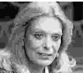
Melina Mercouri hieß eigentlich Maria Amalia Mersuris

Der Name wurde international bekannt durch die griechische Schauspielerin, Sängerin und Politikerin Melina Mercouri (1925-1994). Vielleicht ist das der Grund, warum man ihren Namen aus dem Griechischen ableiten wollte: als Erweiterung der Silbe Mel aus Namen wie Melissa („Honigbiene“) oder Melanie („schwarz“), von griechisch melia , Esche(nholz), oder mit der Bedeutung „von der Insel Melos“. Dabei hat Frau Mercouri ihren eigentlichen Vornamen Amalia lediglich französisiert, denn Melina ist eine altfranzösische Kurzform von Ameline. Als Amelina ist dieser Name schon im Mittelalter belegt, er geht zurück auf Namen, die mit Amal- beginnen (etwa Amalfrida mit dem zweiten Namensteil althochdeutsch fridu , Friede, Schutz). Amal steht dabei für das ostgotische Herrschergeschlecht der Amaler; dessen bekanntester Vertreter war Theoderich der Große (um 454-526). Der Name soll sich ableiten von dem gotischen Wort amals , „eifrig, tüchtig, tapfer“.