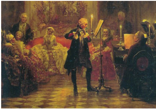
Adolph Menzel: Das Flötenkonzert Friedrich des Großen in Sanssouci, Öl auf Leinwand, 1852.

Am Cembalo sitzt Carl Philipp Emanuel Bach, der 28 Jahre im Dienst des Königs stand