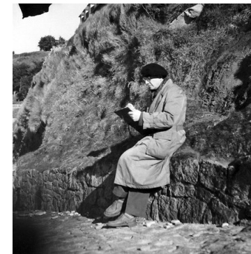
Olivier Messiaen (1908 - 1992)

Dieses Allegro a-moll ist wie das andere Allegro in diesem Konzert keine Originalkomposition für Orgel. Beide Stücke sind aus den von Händel bei Walsh in London verlegten Sonaten für Flöte und Generalbass entnommen. Die Flötenstimme wird hierbei einem solistisch registrierten Manual zugeordnet, die Bassstimme (Cello) dem Pedal und die ausfüllende Mittelstimme der linken Hand auf einen schwächer registrierten Nebenmanual. Beide Adaptionen stammen vom Interpreten des Konzertes.