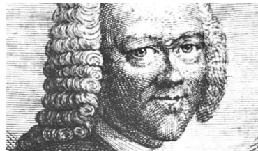
Georg Philipp Telemann (1681 - 1767)