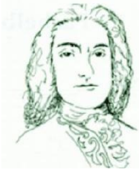
Johann Pachelbel (1653 - 1706) Präludium in d

Der heutzutage oftmals unterschätzte Pachelbel galt seinerzeit als einer der gebildetsten und profundesten