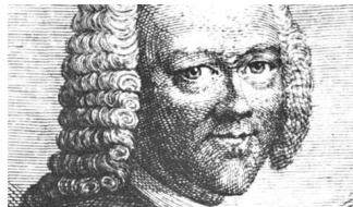
Georg Philipp Telemann

Das Gloria von Vivaldi bringt eine Vertonung des Gloriatextes in Kantatenmanier, bei der jedem Textabschnitt ein selbständiges Musikstück (Arie, Duett, Chor) zugewiesen wird. Musikalisch gesehen neigt Vivaldi den klassischen Kirchenstil zugunsten des konzertanten Stils seiner Zeit, welcher auf Affektdarstellung und Virtuosität ausgerichtet ist.