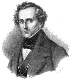
Felix Mendelssohn Bartholdy (1809-1847)

„Denn in seiner Hand ist, was die Erde bringt, und die Höhen der Berge sind