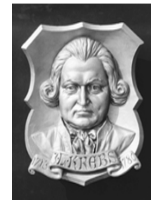
Johann Ludwig Krebs